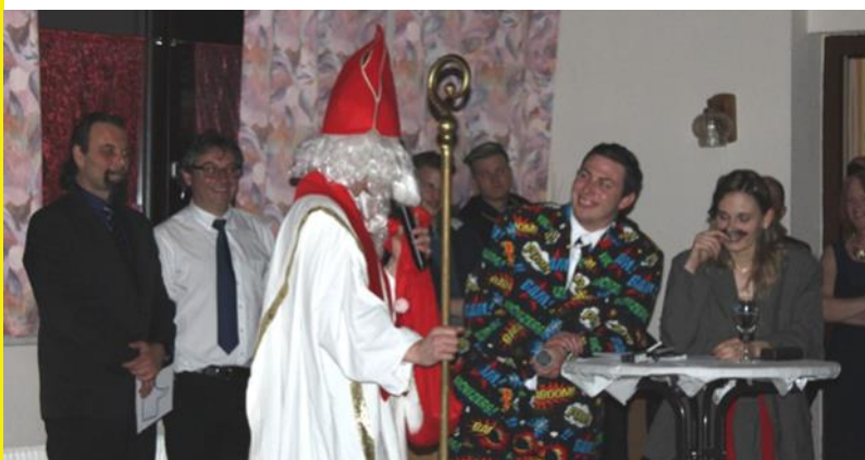
Bei der Mitternachtseinlage hatte sogar der Nikolaus einen Auftritt.