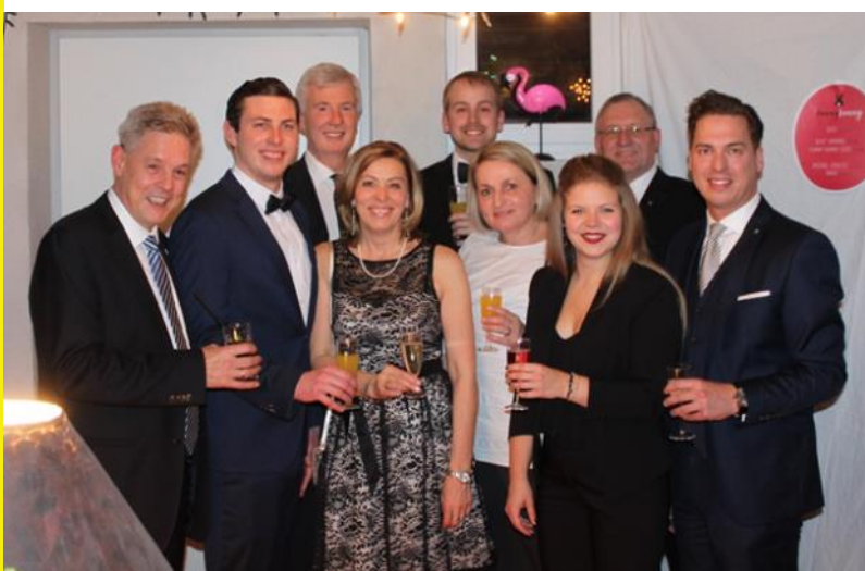
Mit unseren Ehrengästen: